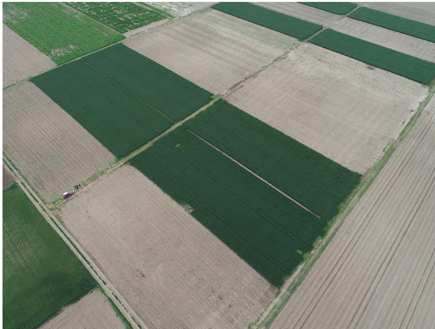
Институт за ратарство и повртарство, Римски шанчеви, оглед „Плодореди“